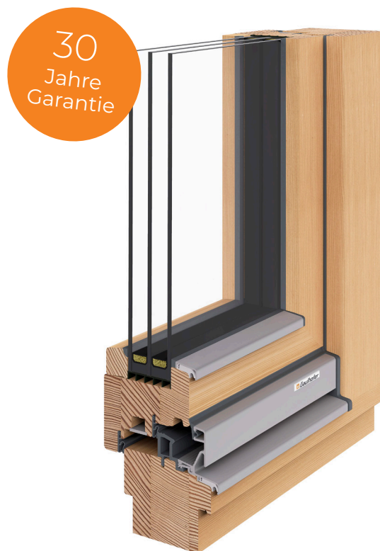
Holz NATURELINE 78